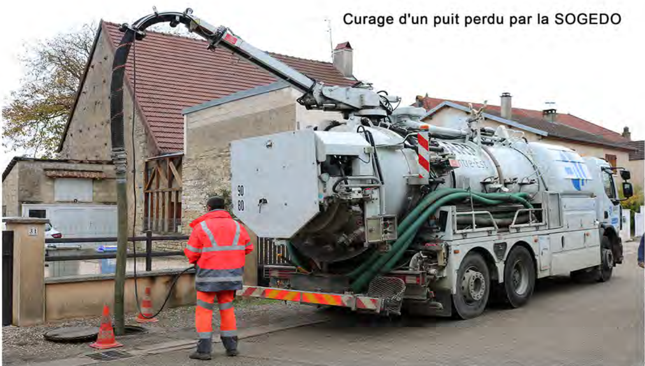
Curage d'un puit perdu par la SOGEDO